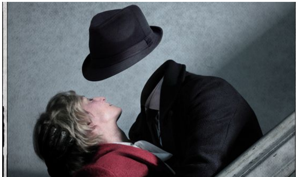
Una escena de la adaptación de 'L'home invisible' para la sala Escalante.

Tres pesos pesados de la escena valenciana han puesto manos a la obra para rehacer en valenciano El hombre invisible , el clásico de la ciencia ficción de H. G. Wells, destinado al público infantil de la Sala Escalante de Valencia, donde se representa este domingo a las seis de la tarde y permanecerá hasta el seis de marzo.